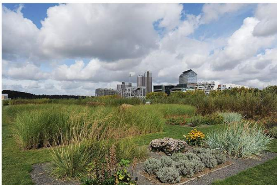
L'île Seguin, Le jardin réalisé par Michel Desvignes (état en 2013)

FAITES DE L'ÎLE UN BEL ESPACE DE RESPIRATION